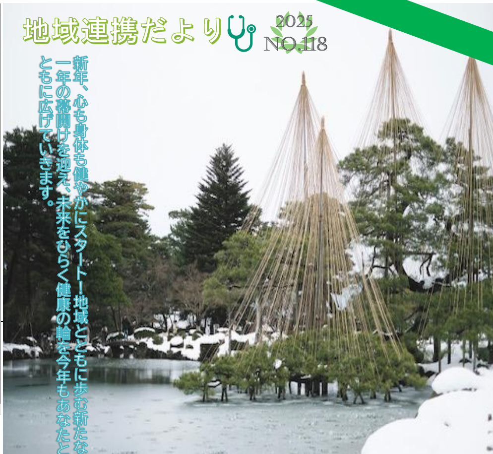
冬の兼六園

新年、心も身体も健やかにスタート！地域とともに歩む新たな一年の幕開けを迎え、未来をひらく健康の輪を今年もあなたとともに広げていきます。