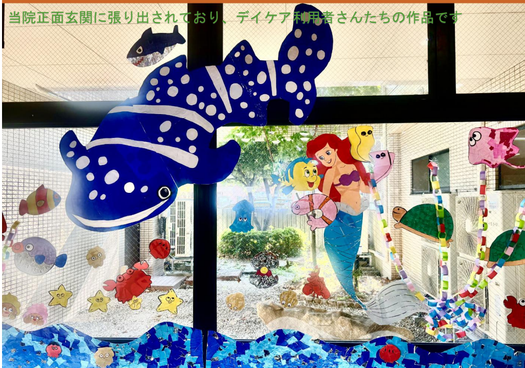
当院正面玄関に張り出されており、デイケア利用者さんたちの作品です

少しずつ夕暮れが早くなり、秋の気配を感じる頃になりました。とはいえ、まだまだ暑い日が続きますね。体調に気をつけて、無理せず元気に過ごしていきましょう。